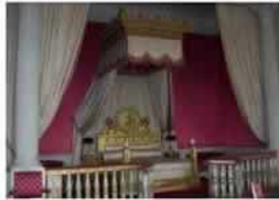
Mi habitación. La cama era dura pero no la quisieron cambiar porque decían que aquí había dormido un emperador. Sí, ya...