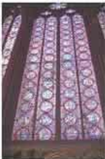
La ventana de la habitación.