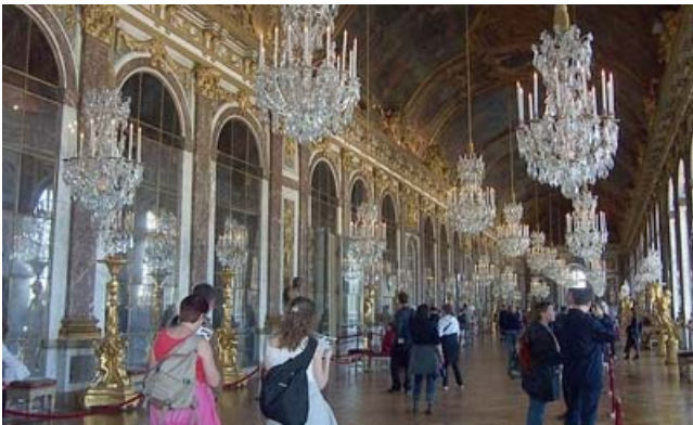
Versalles. Sala de los espejos