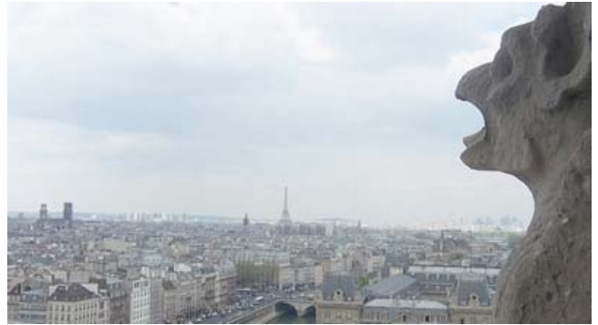
Vistas desde Notre Dame