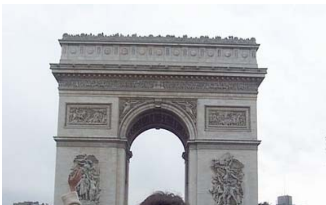
Arco de Triunfo