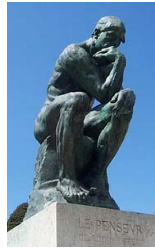
El pensador Museo Rodin