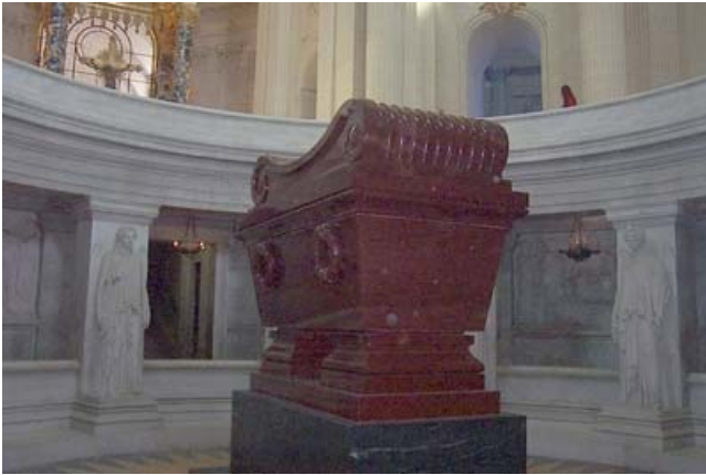
Tumba de Napoleón Les Invalides