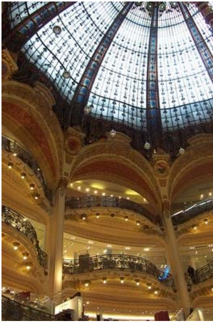
Galerias La Fayette