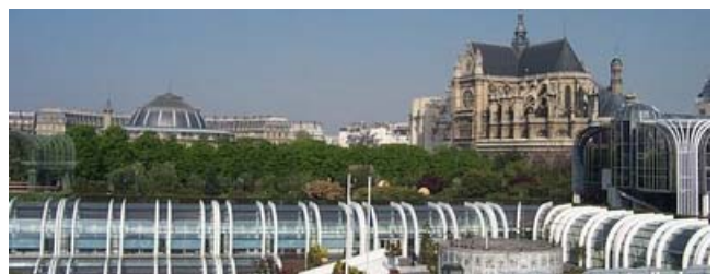
Les Halles Iglesia de Saint-Eustache