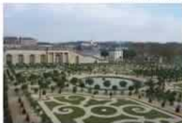
Las vistas desde la ventana