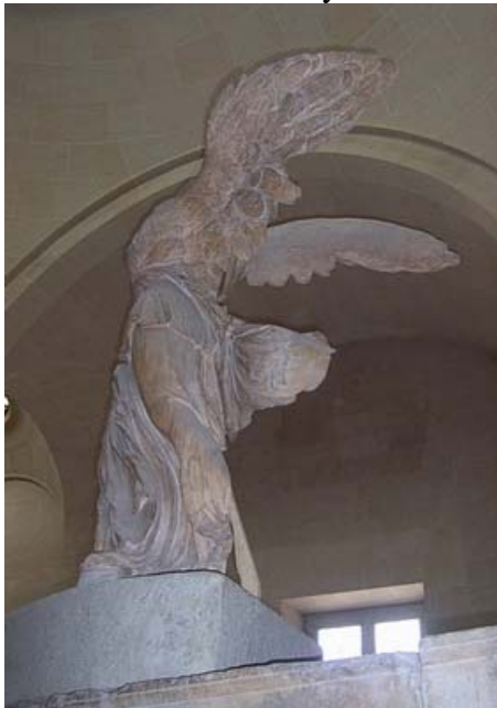
La Victoria de Samotracia Louvre