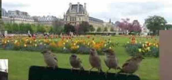
Un día ligué con unos franceses...