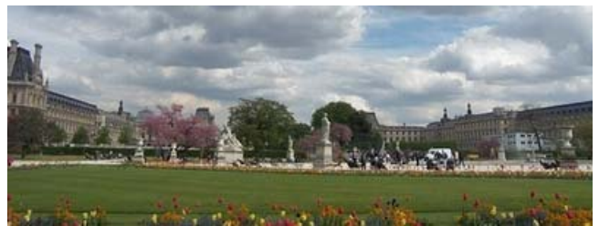
Jardines de las Tullerías