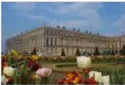
El hotel. Sólo dos estrellas y bastante viejo.

Como no pretendo daros ninguna envidia, sólo os voy a enseñar las fotos que hice de mi hotel .