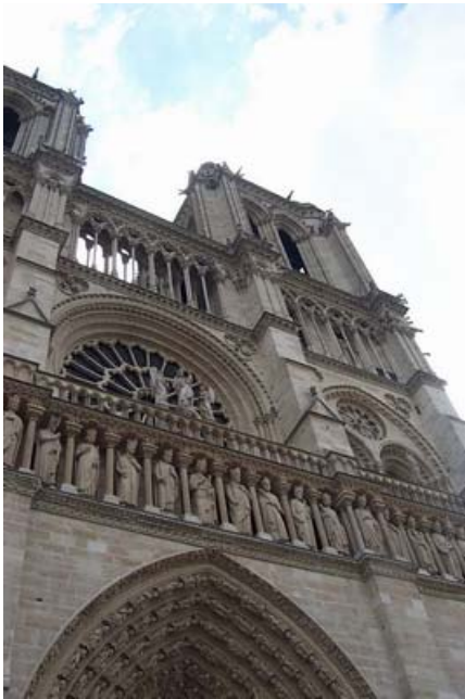
Notre Dame de Paris